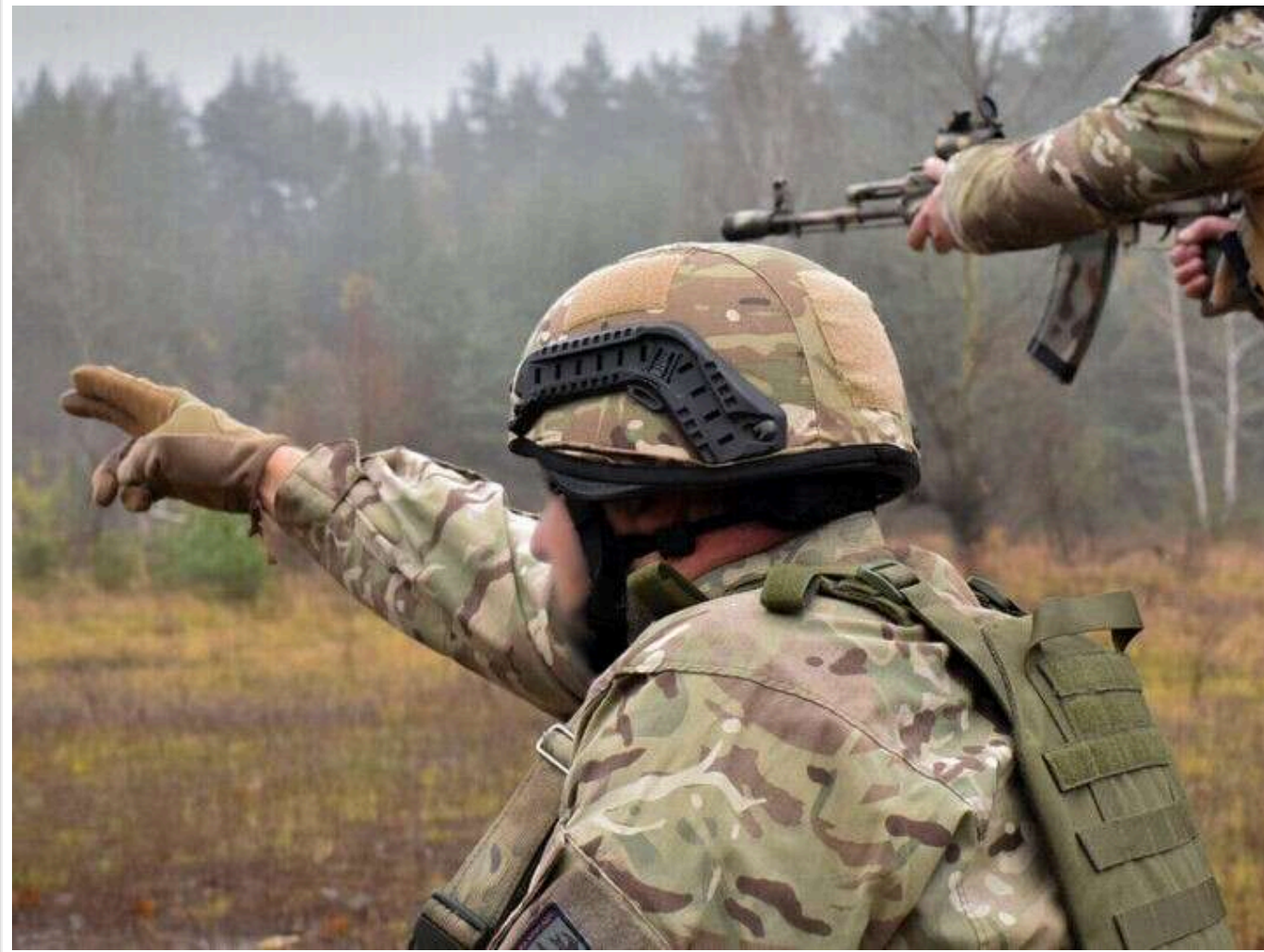
В Офісі Генпрокурора назвали генералів, бездіяльність яких призвела до захоплення частини Харківщини

Затримано генералів бездіяльність яких призвела до захоплення частини Харківщини у 2024, втрати особового складу та озброєння, зриву заходів із забезпечення оборони державного кордону України - Офіс Генпрокурора.