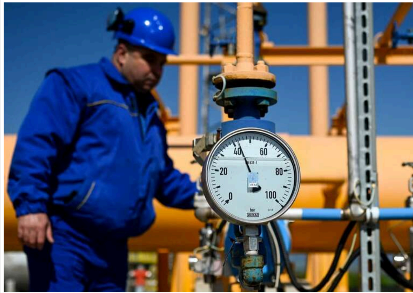
В Придністров'ї погодилися отримувати газ на умовах Молдови

Компанія "Тираспольгаз" з незвіданої Придністровської Молдавської Республіки погодилися отримувати газ через молдавську компанію "Молдовагаз".