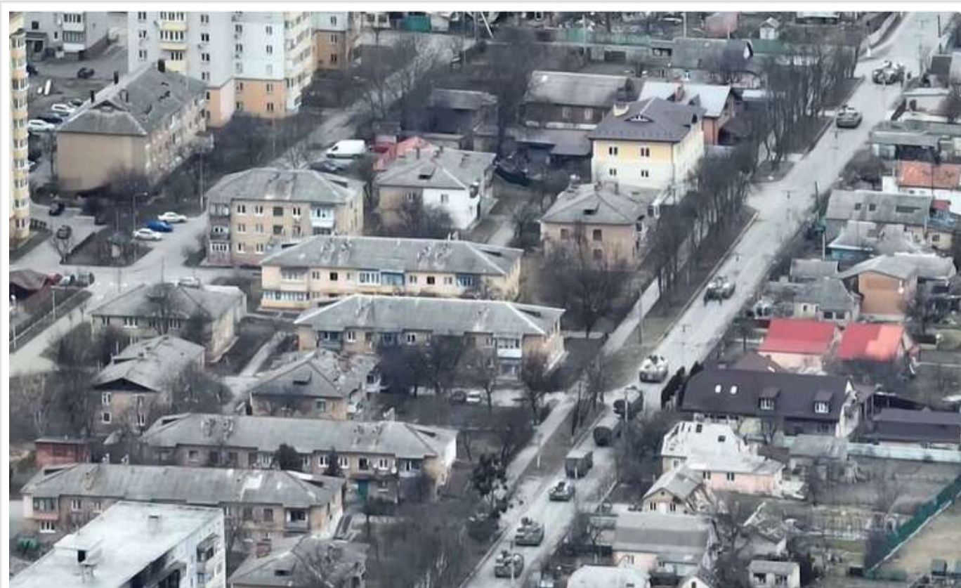
Поліцейські повідомили про підозру командир російських десантників, який наказав розстрілювати цивільних у Бучі

Нацполіція повідомила про підозру командир російських десантників, причетних до розстрілів людей на перехресті Вокзальної та Яблунської в Бучі. Жертвами окупантів стали 16 цивільних.