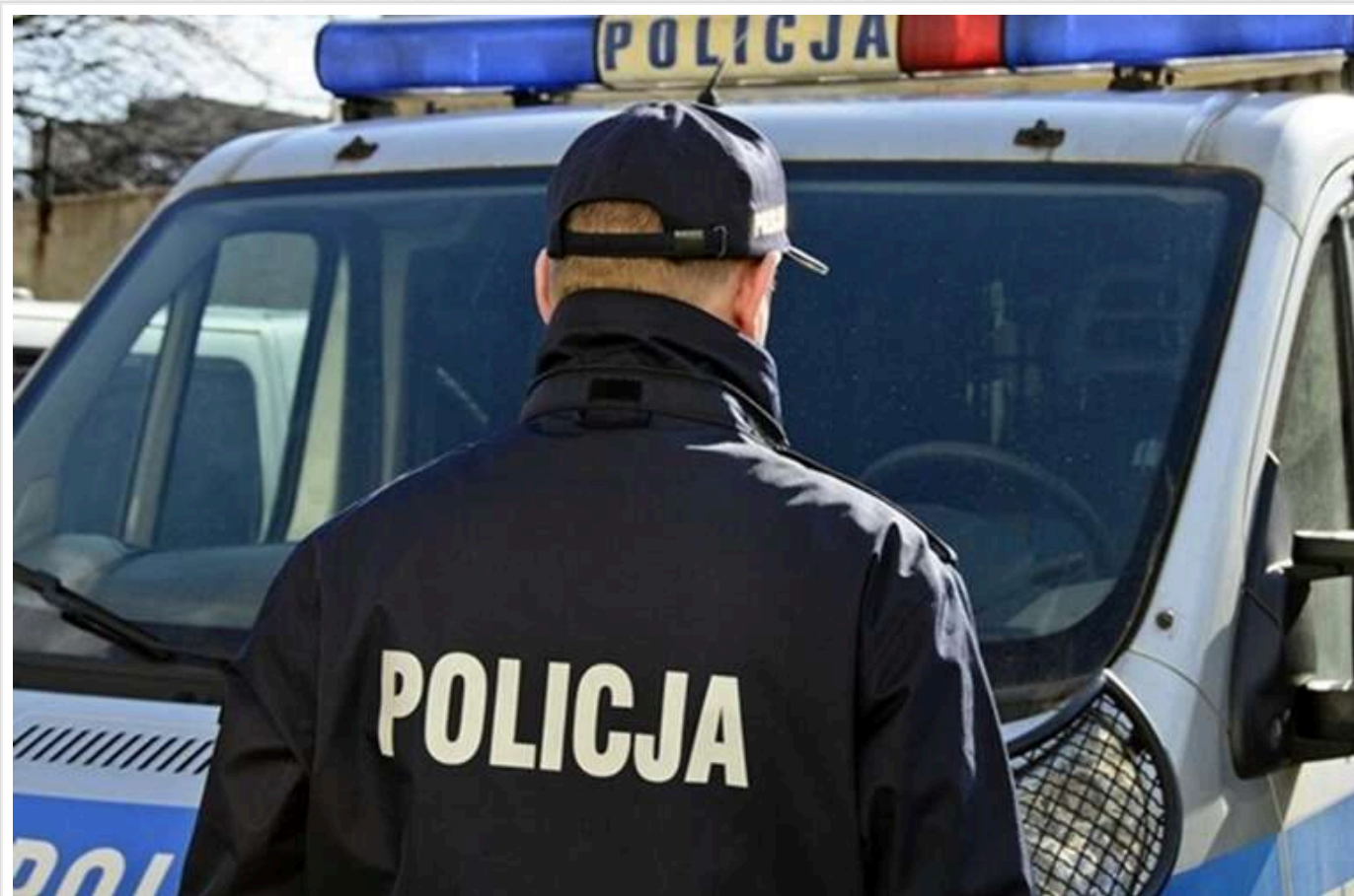
У Варшаві затримали двох іноземців: один з них - грузин, якого розшукують в Україні за вбивство

В жовтні минулого року варшавські поліцейські затримали двох іноземців, які побачивши співробітників поліції, спробували змішатися з натовпом хорватських уболівальників перед матчем Польща-Хорватія.