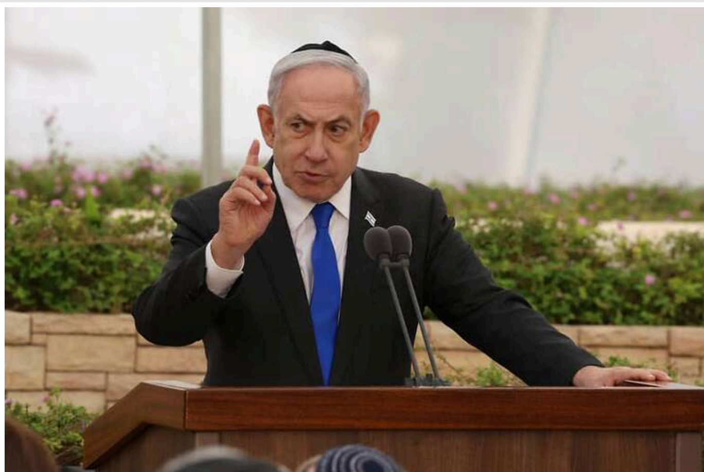
Нетаньягу прокоментував звільнення заручників, які «пройшли через пекло»

Повернення трьох ізраїльтянок з полону ХАМАС 19 січня прем'єр-міністр країни Біньямін Нетаньягу назвав неймовірно зворушливим днем. Він зазначив, що Ромі Гонен, Емілі Дамарі та Дорон Штайнбрехер відомі "вітала вся нація".