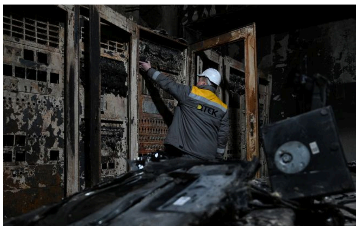
Фото: внаслідок ворожого обстрілу 2 червня пошкоджена енергоінфраструктура