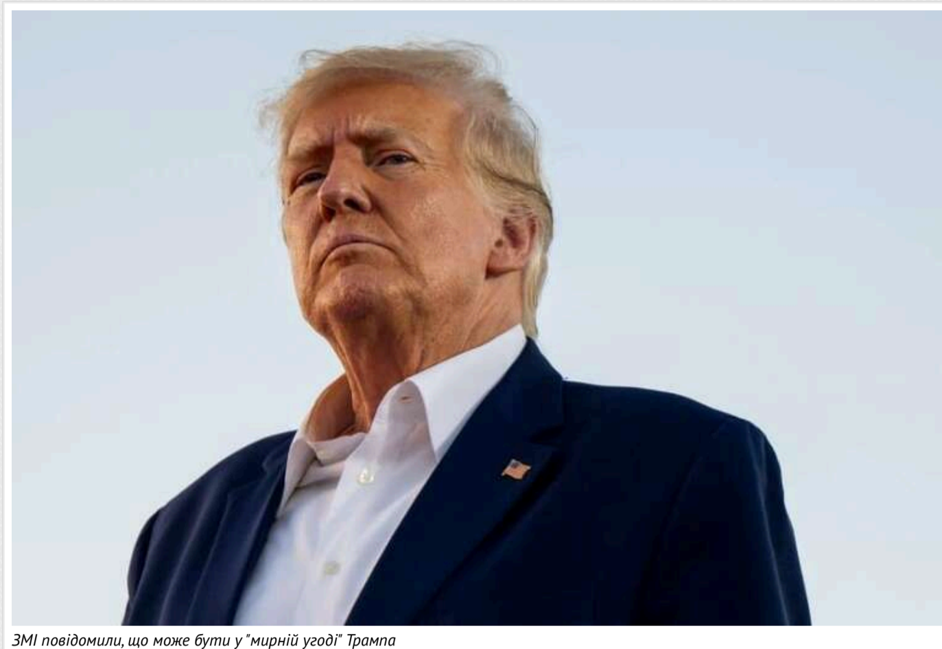
ЗМІ повідомили, що може бути у "мирній угоді" Трампа

Протягом передвиборчої кампанії обраний президент США Дональд Трамп неодноразово обіцяв зупинити війну в Україні за 24 години. Проте після інавгурації та вступу на посаду глави держави реалізація таких обіцянок виглядає складніше.