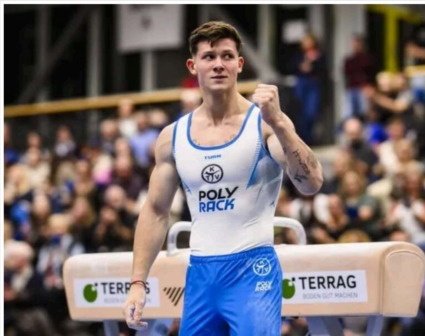
В НОК обурені зміною громадянства гімнастом Ковтуном під час війни

Очільник НОК України Вадим Гутцайт заявив, що для нього стало несподіванкою те, що срібний призер Олімпіади-2024 зі спортивної гімнастики Ілля Ковтун намагається отримати хорватське громадянство. Він підкреслив, що держава вклала значні ресурси у підготовку Ковтуна з дитинства, що дало йому змогу досягти олімпійського успіху навіть у складний для України період війни.