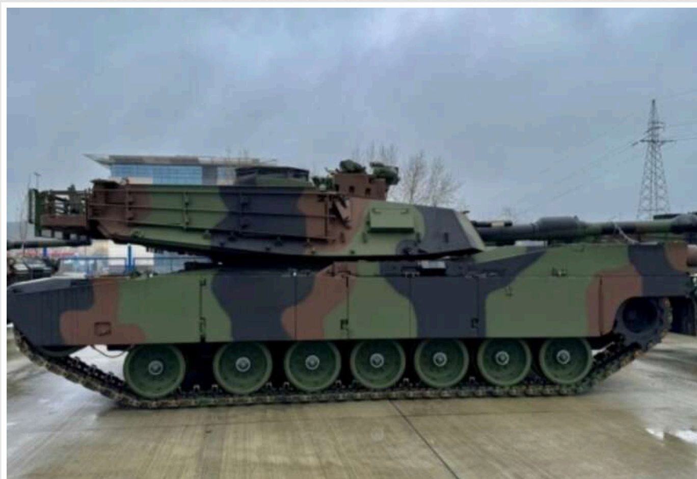
США уже передали Польщі першу партію танків Abrams у найновішій версії

Польща отримала від США перші 28 танків Abrams у найновішій версії M1A2SEPv3, які доставлено до РП морським шляхом.