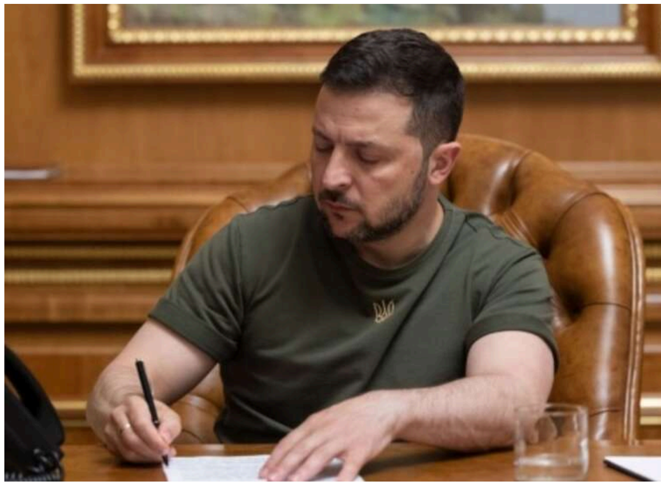
Зеленський підписав указ щодо санкцій проти пропагандистів та прихильників Росії

Президент України Володимир Зеленський повідомив, що підписав указ про введення санкцій РНБО проти пропагандистів, які працюють на Росію, а також осіб, які перейшли на бік ворога або допомагають Росії у веденні війни.