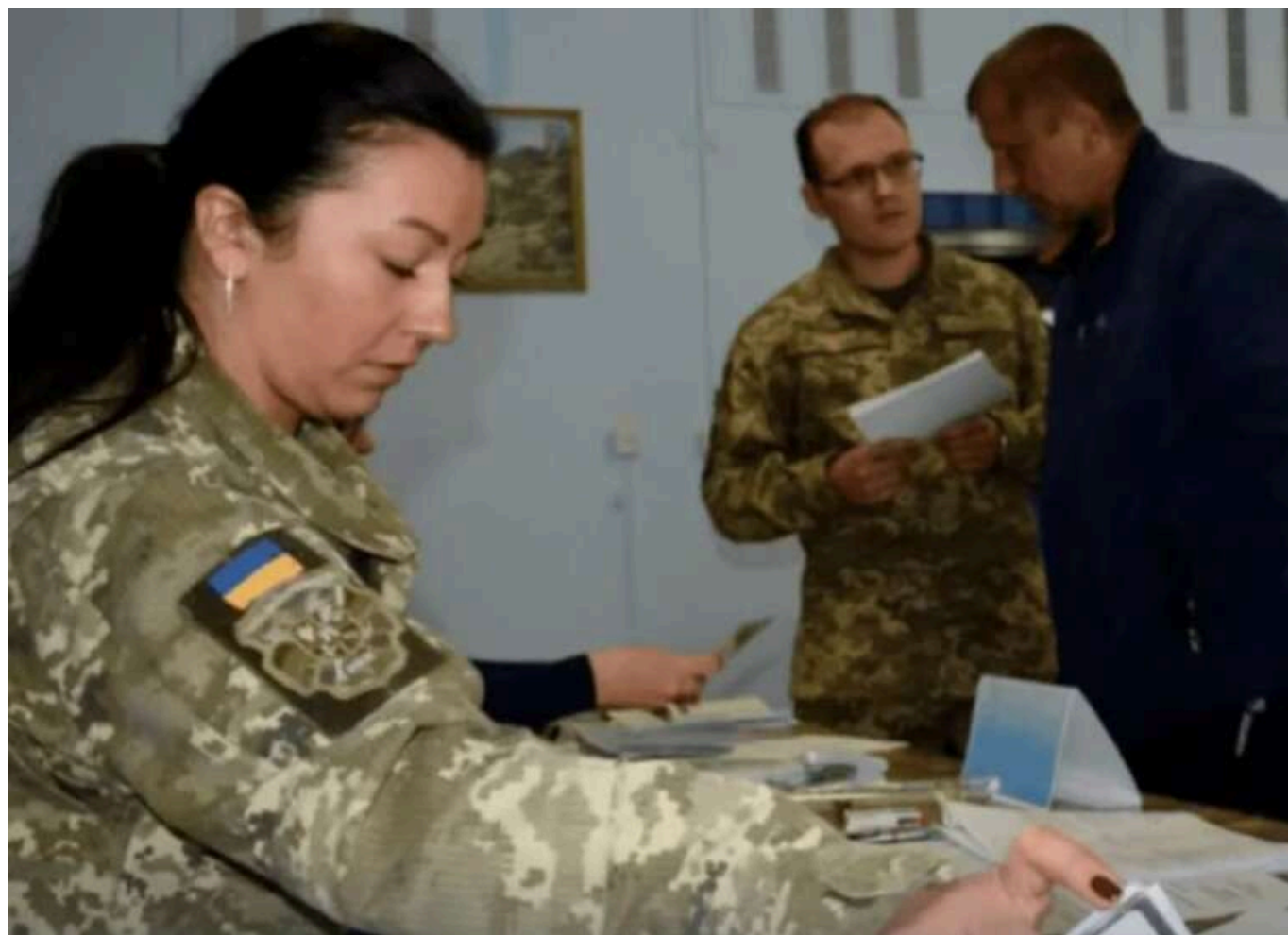
Як продовжити відстрочку від мобілізації в Україні: правила подання документів

Відстрочка від мобілізації в Україні не є безстроковою, тому через певний час її необхідно поновлювати. ЗМІ з'ясували, що для цього потрібно, та чи відправлять у військо людину, якій не встигли продовжити відстрочку.