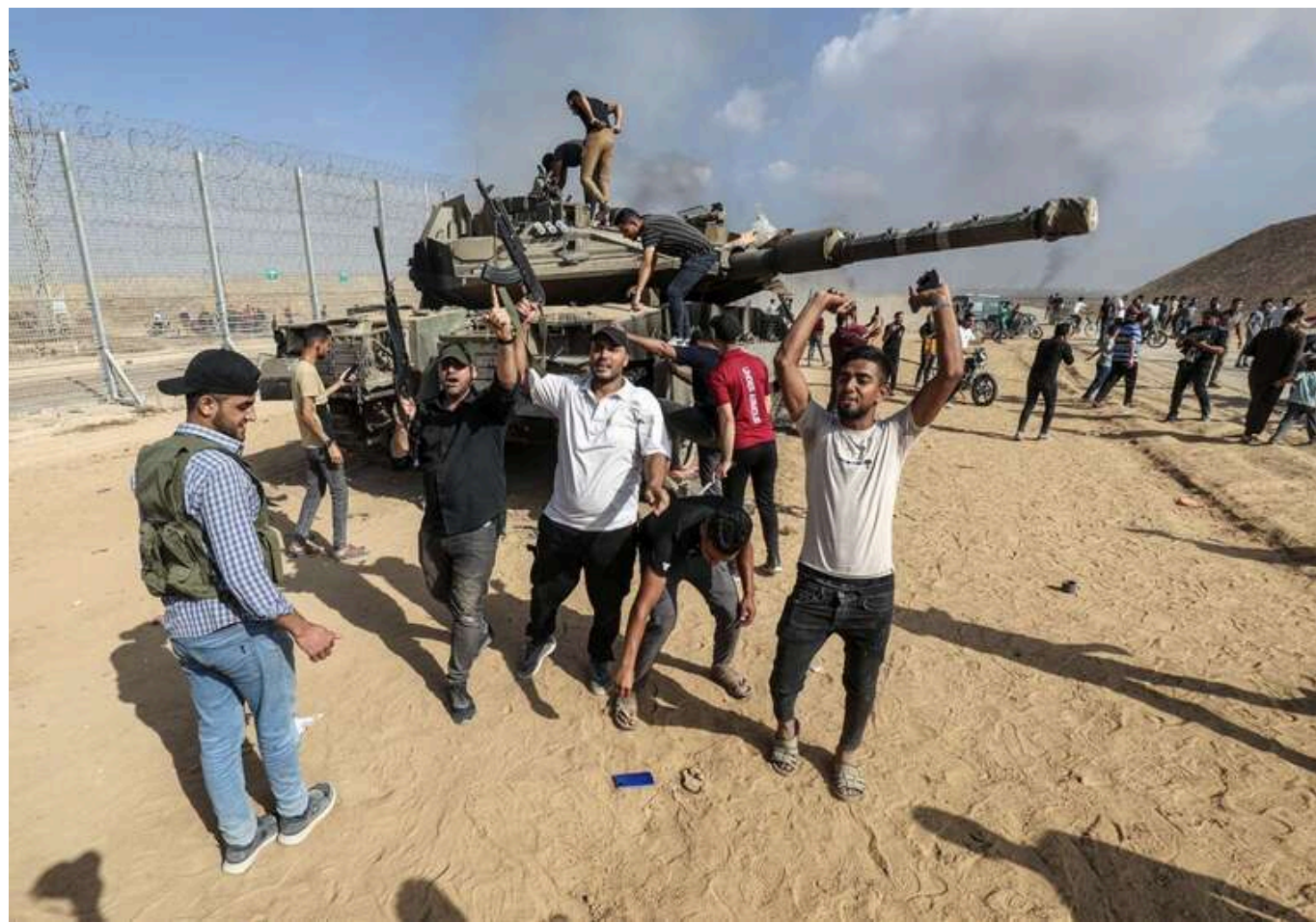
ХАМАС надіслав список заручників, які будуть звільнені сьогодні: Ізраїль показав фото

ХАМАС надіслав список заручників, які будуть звільнені 19 січня. Мова про трьох цивільних жінок.