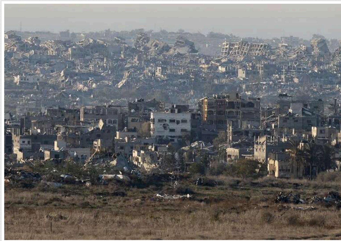
Набуло чинності перемир'я в Секторі Гази

У Секторі Гази набула чинності домовленість про припинення вогню. Цю інформацію підтвердила ізраїльська влада.