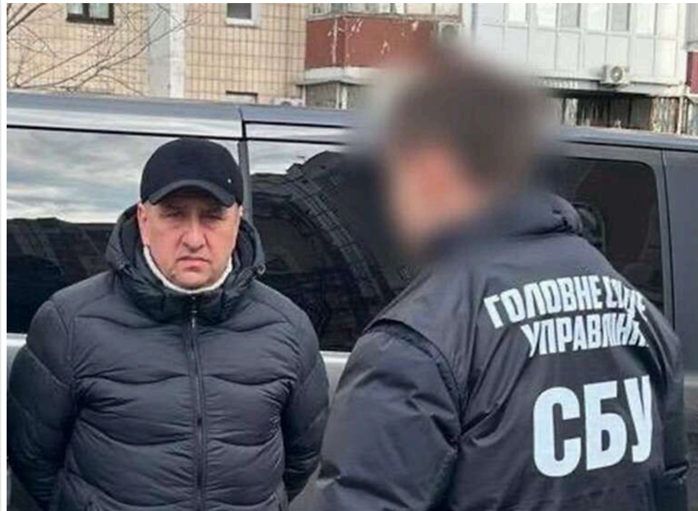
В Україні викрито адвоката, який співпрацював з розвідкою РФ та вербував агентів

За процесуального керівництва Офісу генерального прокурора адвокату повідомлено про підозру в державній зраді, вчиненій в умовах воєнного стану (ч. 1, ч. 2 ст. 111 КК України).