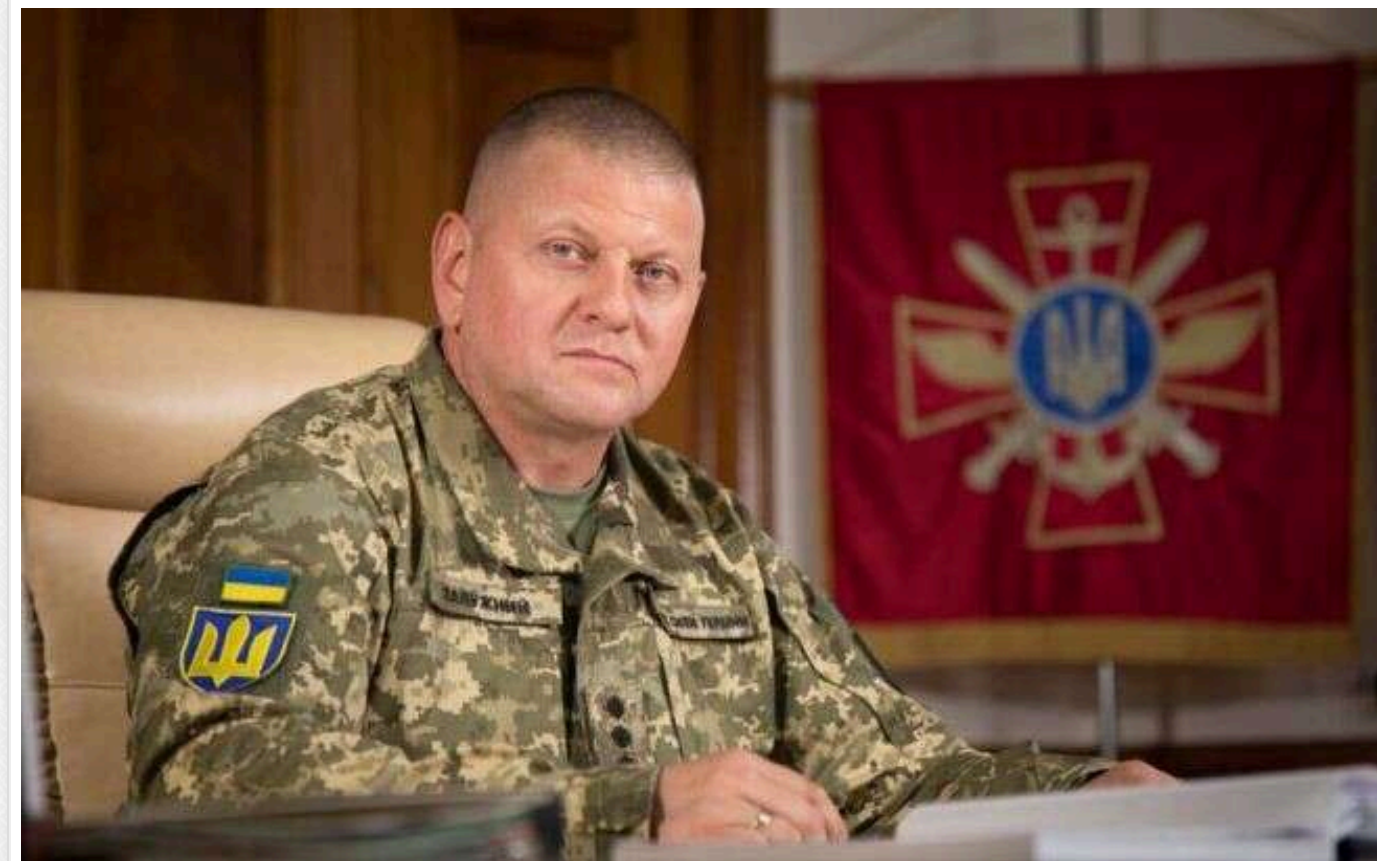
Валерій Залужний показав пробиті гільзи після своїх стрілецьких тренувань

Валерій Залужний після звільнення з військової служби не припиняє вдосконалювати свої стрілецькі навички. Він поділився в мережі фотографією зі стрільбища.