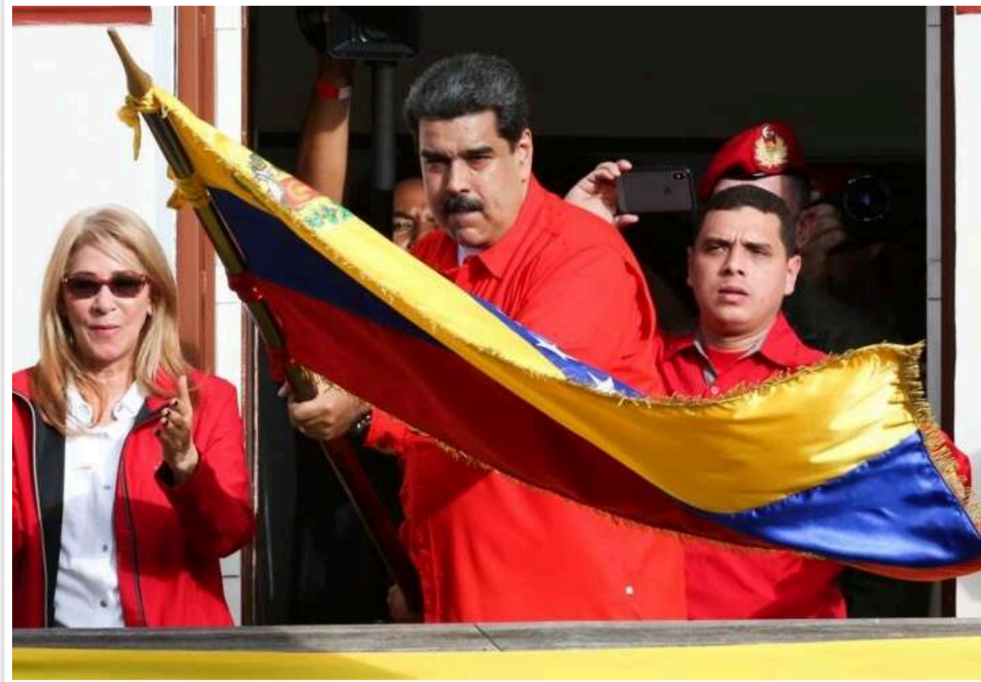
Адміністрація Трампа хоче зміни режиму у Венесуелі

За даними Axios, нова адміністрація Трампа прагне до зміни влади у Венесуелі, посилюючись на радника обраного президента.