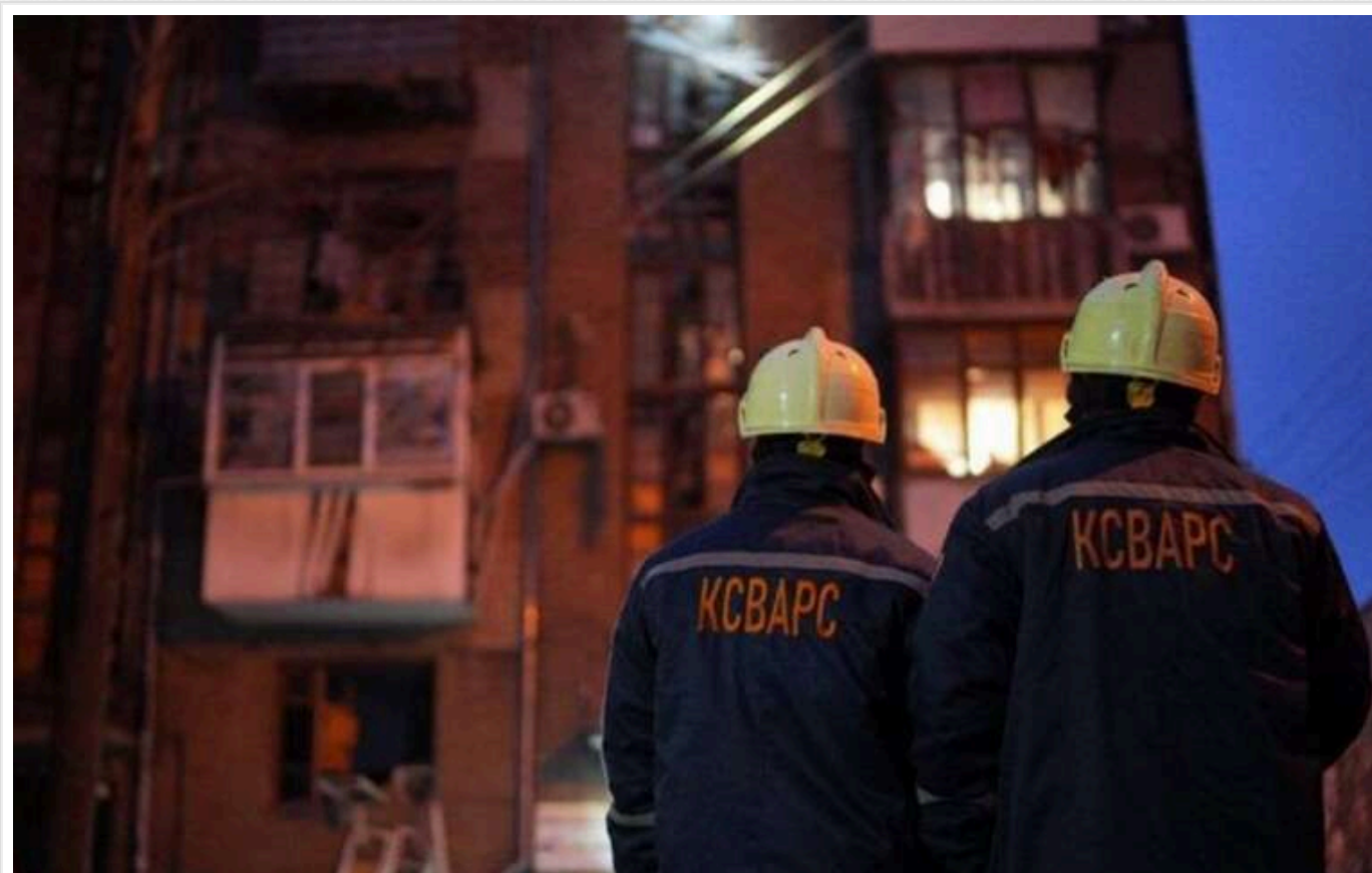
Кількість постраждалих від ранкового обстрілу в Запоріжжі збільшилася до 12 осіб

Кількість постраждалих унаслідок ранкової ракетної атаки на Запоріжжя зростає до 12 осіб.