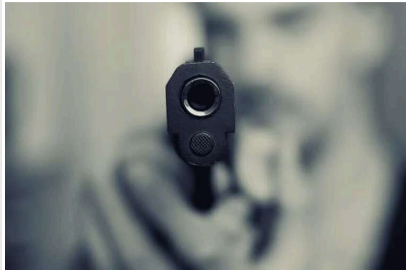
У столиці Ірану застрелили двох суддів: ще одного поранили

У столиці Ірану, Тегерані, зловмисник відкрив стрілянину біля штаб-квартири Верховного суду, внаслідок чого загинули щонайменше двоє суддів, а третій отримав поранення.