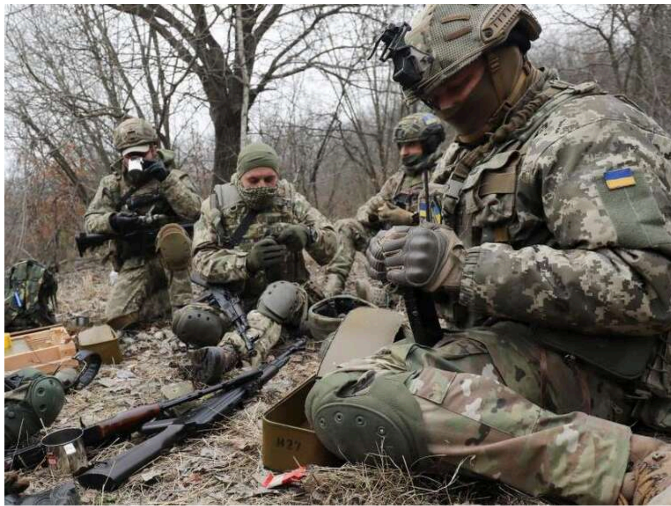
Ситуація на фронті: Від початку доби відбулося 176 боєзіткнень, з них 84 - на Покровському напрямку

З початку цієї доби на фронті зафіксовано 176 бойових зіткнень. Найбільшу кількість боїв спостерігали на Покровському напрямку.