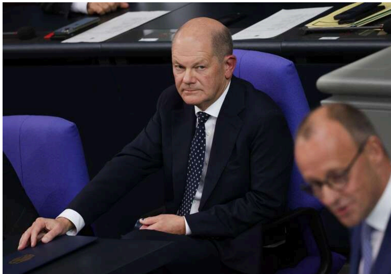
Шольц назвав Ілона Маска загрозою демократичному розвитку Європи

Канцлер Німеччини Олаф Шольц назвав «неприйнятною» підтримку мільярдером Ілоном Маском певних політичних сил у Європі і вважає його загрозою для демократичного розвитку регіону.