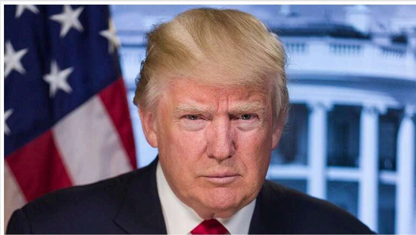
Politico: Команда Трампа хоче оголосити НС для боротьби з мігрантами в США

За повідомленням Politico, команда Трампа готує оголошення надзвичайного стану для боротьби з нелегальною міграцією.