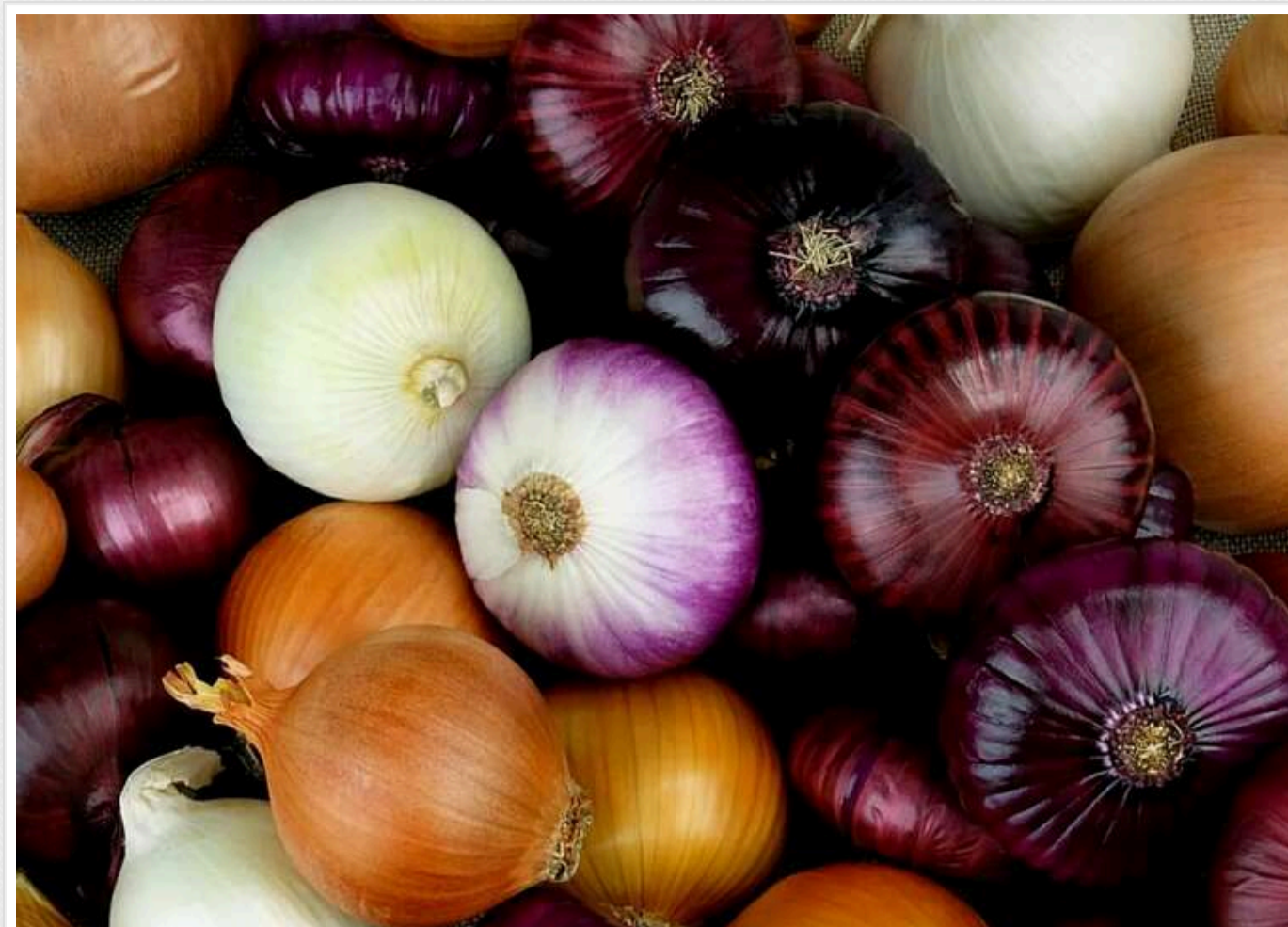
В Україні різко здешевшала цибуля через поганий врожай

В Україні масово падає ціна на цибулю від місцевих виробників через різке зниження якості торішньої продукції та зменшення попиту. При цьому дефіциту на цей овоч не спостерігається, але навесні ціни можуть зрости.