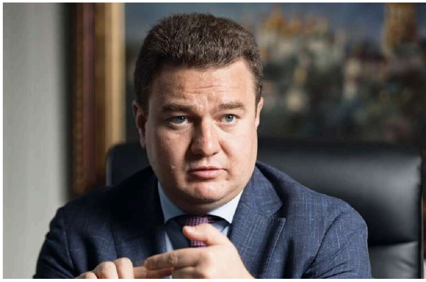
Нардеп Бондар, якого затримали за корупцію, задекларував готівкою 674 тисячі доларів

Народний депутат Віктор Бондар, якого затримали через корупційні махінації в «Укрзалізниці», задекларував 674 тис. доларів і 195 тис. євро готівкою.