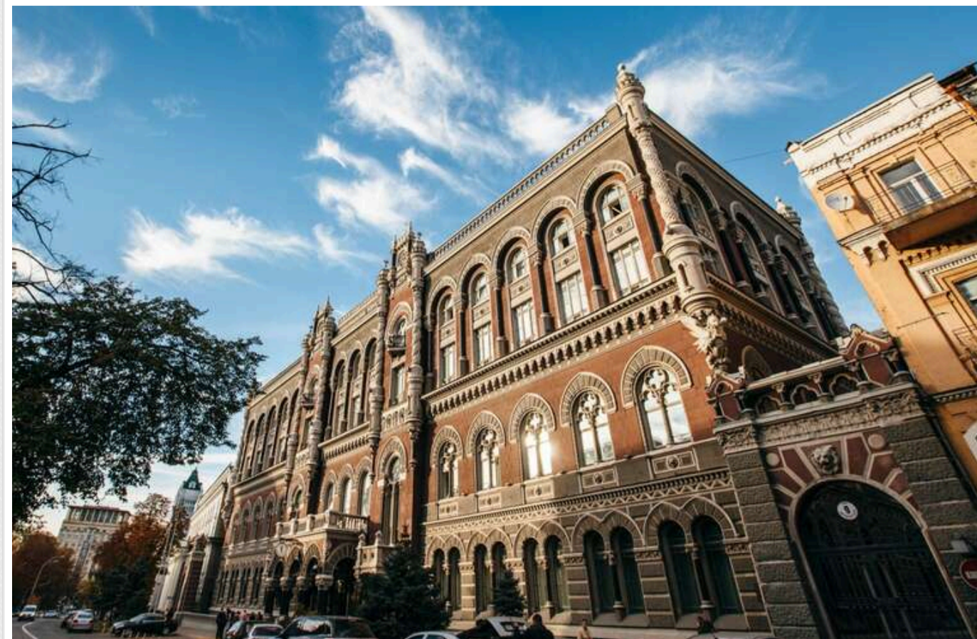
Нацбанк виступив проти розкриття банківської таємниці

Національний банк України заперечує надання безконтрольного і необмеженого позасудового доступу до банківської таємниці для будь-якого органу.