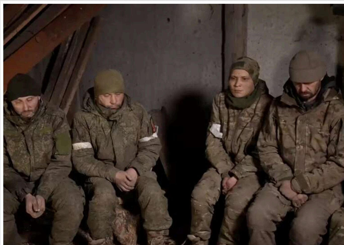
На Курахівському напрямку ЗСУ взяли штурмом позицію РФ: полонили окупантів

Бійці 79-ї окремої десантно-штурмової бригади ЗСУ атакували позицію російських загарбників на Курахівському напрямку. Наші військові не лише захопили територію, але й узяли в полон сімох окупантів.