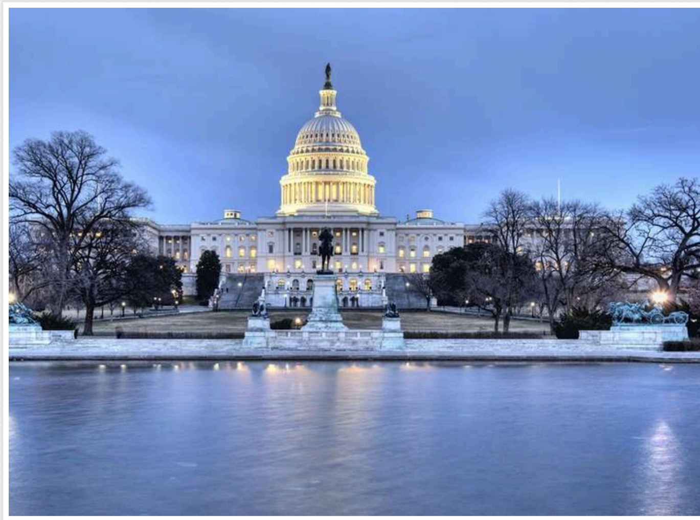
Інаугурація Трампа пройде в ротонді Капітолія

Трам повідомив, що його інаугурація відбудеться в приміщенні – у ротонді Капітолію. Пояснив це вибором через холодну погоду у Вашингтоні.