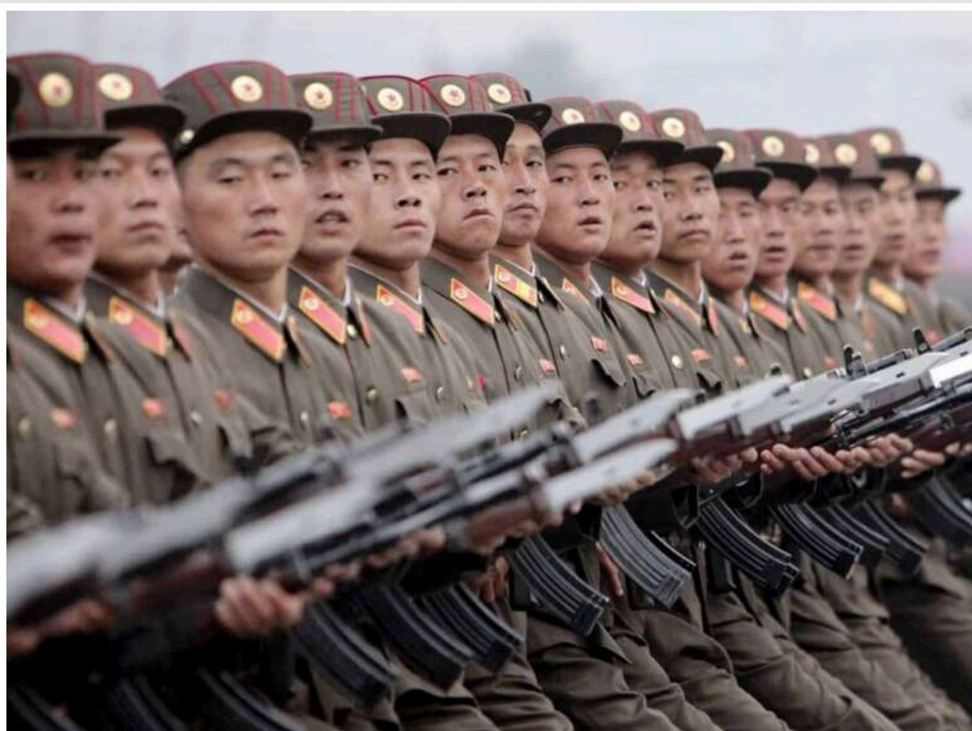
Посол Південної Кореї: Солдати КНДР думали, що їдуть на навчання, а не воювати проти України

Солдати КНДР нібито не знали, що їх відправляють до Росії для того, щоб воювати проти України. Вони думали, що потраплять на військові навчання.