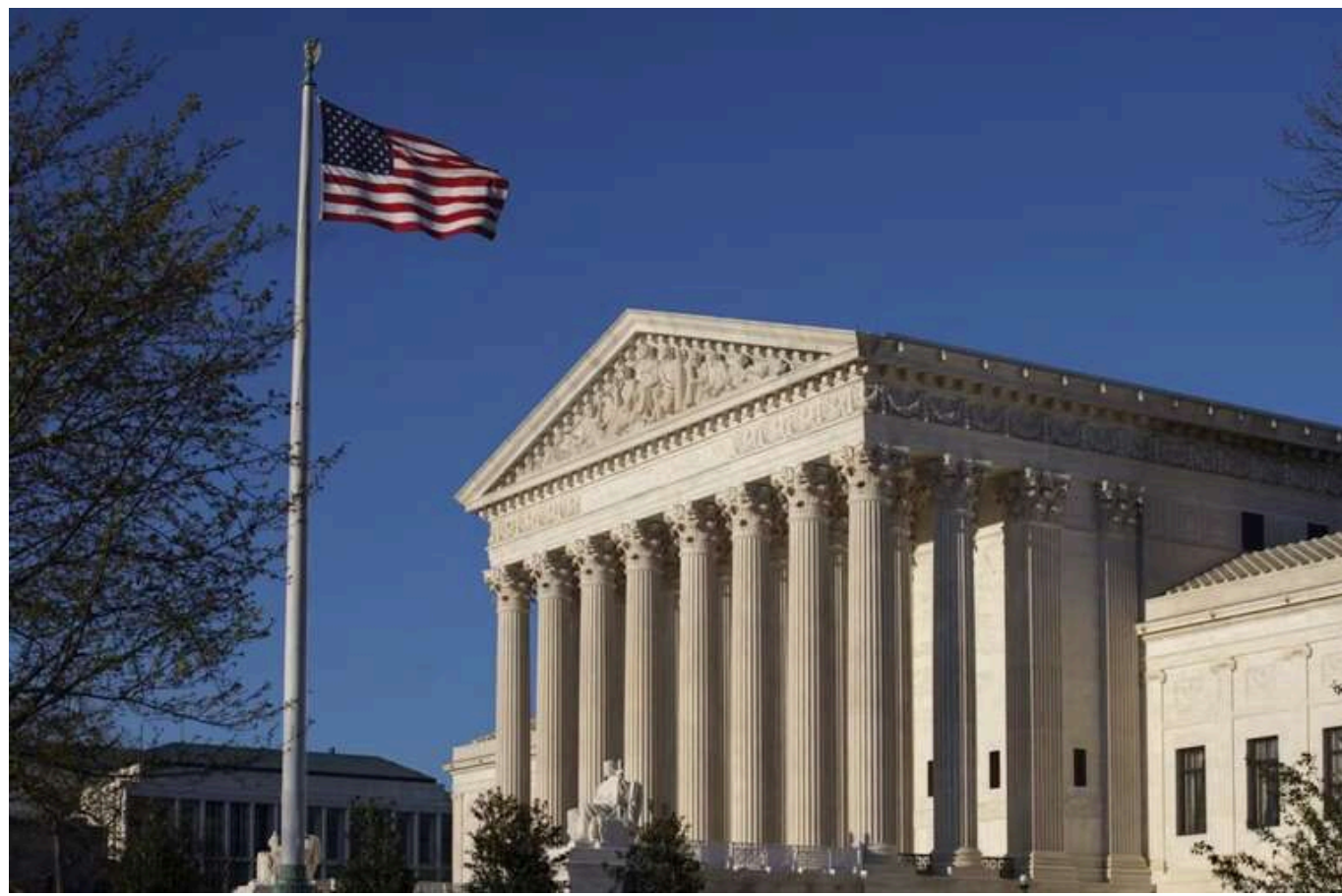
Верховний суд США підтримав заборону TikTok, але рішення за Трампом

Верховний Суд США підтвердив заборону на TikTok, але Трамп заявив, що остаточне рішення щодо майбутнього соцмережі в країні залишається за ним.