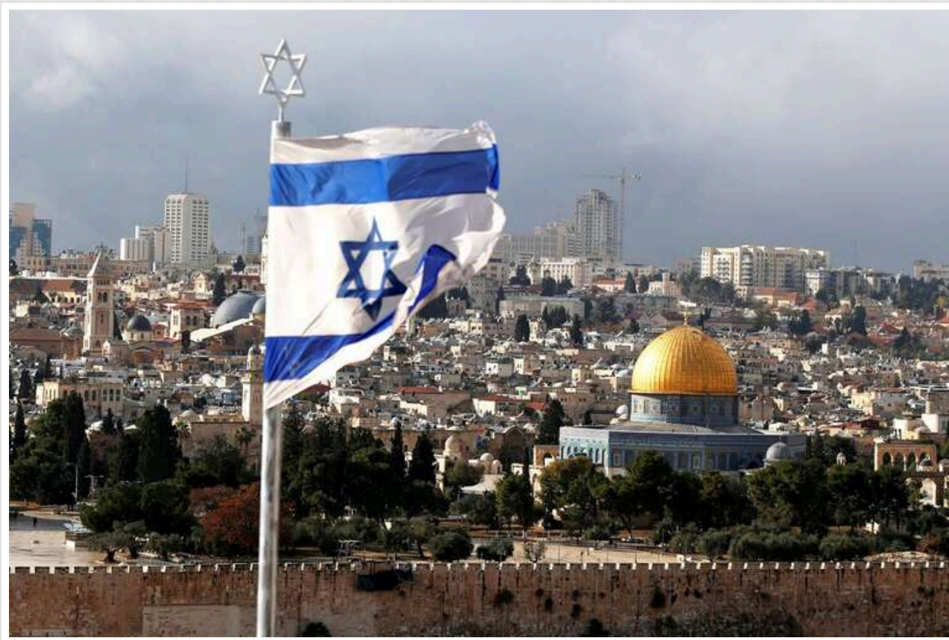
Військово-політичний кабінет Ізраїлю схвалив угоду з ХАМАСом

Військово-політичний кабінет Ізраїлю затвердив угоду з ХАМАСом щодо звільнення заручників. Тепер вона буде передана на розгляд ізраїльському уряду.