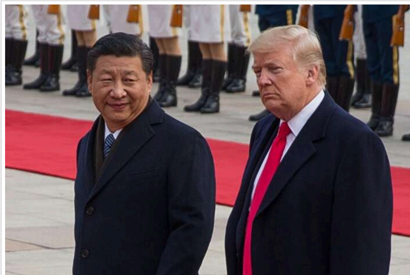
Сі Цзіньпін провів телефонну розмову з Дональдом Трампом

У п'ятницю, 17 січня, китайський лідер Сі Цзіньпін провів телефонну розмову з обраним президентом США Дональдом Трампом, повідомляє агентство Сінхуа.