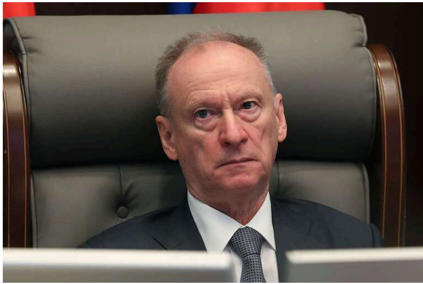
В Британській розвідці пояснили маніпулятивні погрози Патрушева про те, що Україна "припинить існування"

У британській розвідці вважають, що заява колишнього секретаря Радбезу РФ Миколи Патрушева про «припинення існування України у 2025 році» є частиною давньої практики російських високопосадовців, спрямованої на підрив та загрозу українській державності, ідентичності та культурі.