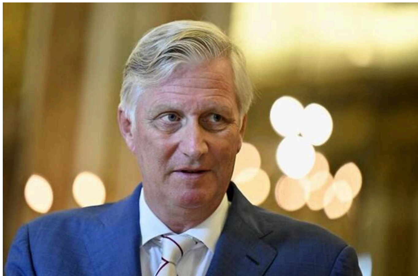
В разі вето Орбана на санкції проти Росії ЄС залучить бельгійського короля, - FT

У Європейському Союзі розглядають можливості на випадок вето Угорщини на продовження санкцій проти Москви. Одним зі способів може стати закон Королівства Бельгії періоду Другої світової війни.