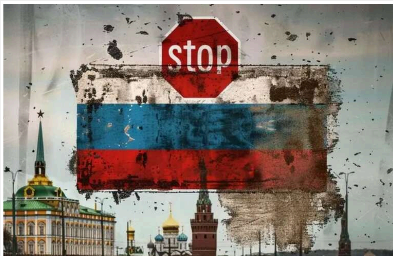
Компанії з ЄС поповнили бюджет РФ на 3 мільярди доларів

Європейські компанії у 2024 році доповнили бюджет Російської Федерації на 3 мільярди доларів, а також надавали їй підприємствам критично важливу технічну підтримку. Це зводить нанівець дію санкцій та інших заходів, що послабили можливості країни-агресорки до ведення повномасштабної війни проти України.