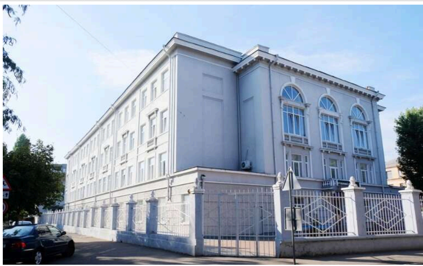
В Одесі чиновники міської ради привласнили гроші, виділені на ремонт шкільного укриття

В Одесі поліція розслідує корупційну схему у сфері будівництва укриттів у закладах освіти міста.