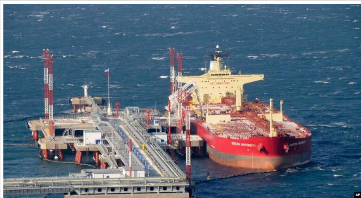
Китай продовжує приймати танкери з російською нафтою під санкціями

Китайський порт Лунгоу прийняв перше судно з російською нафтою після введення нових санкцій США.