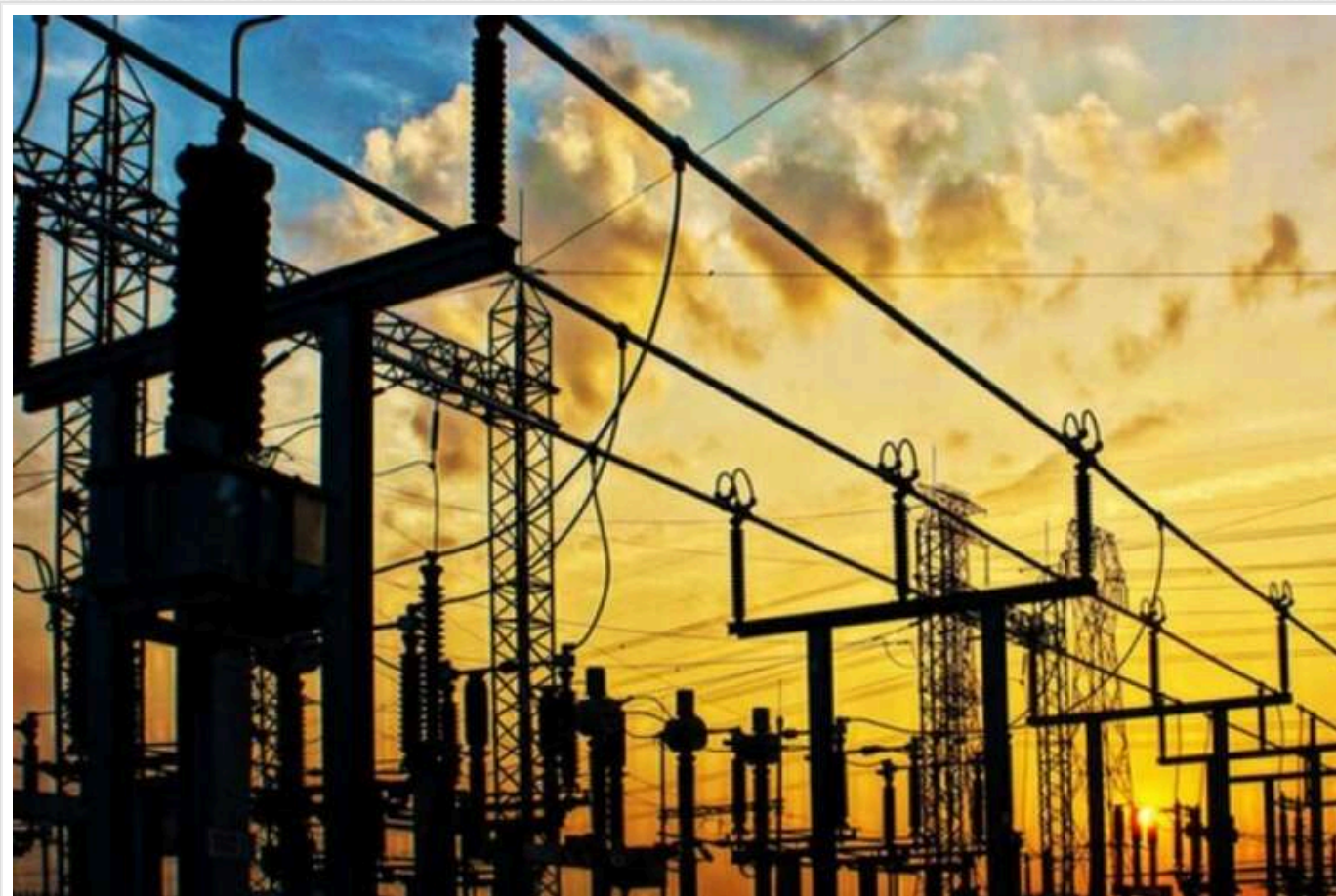
Україна створила лише 13% від обіцяного Зеленським гігавата енергогенерації

Замість запланованого 1 ГВт енергогенерації, за підрахунками «Укренерго», вдалося створити лише 133 МВт, що складає трохи більше однієї десятої частини від заявленого обсягу.