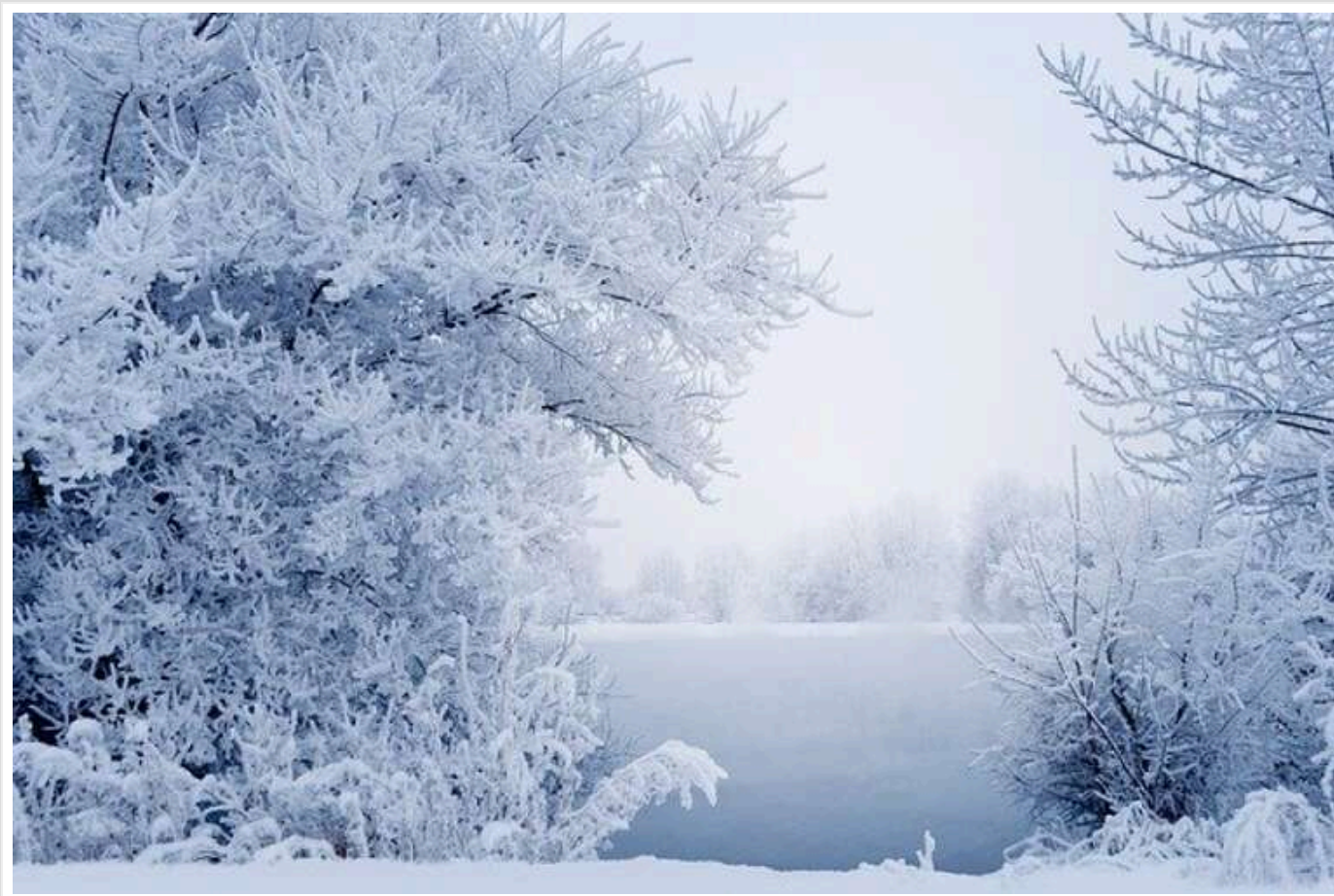
Сильні морози будуть вже після 24 січня: на Україну насувається антициклон із Гренландії, – синоптики