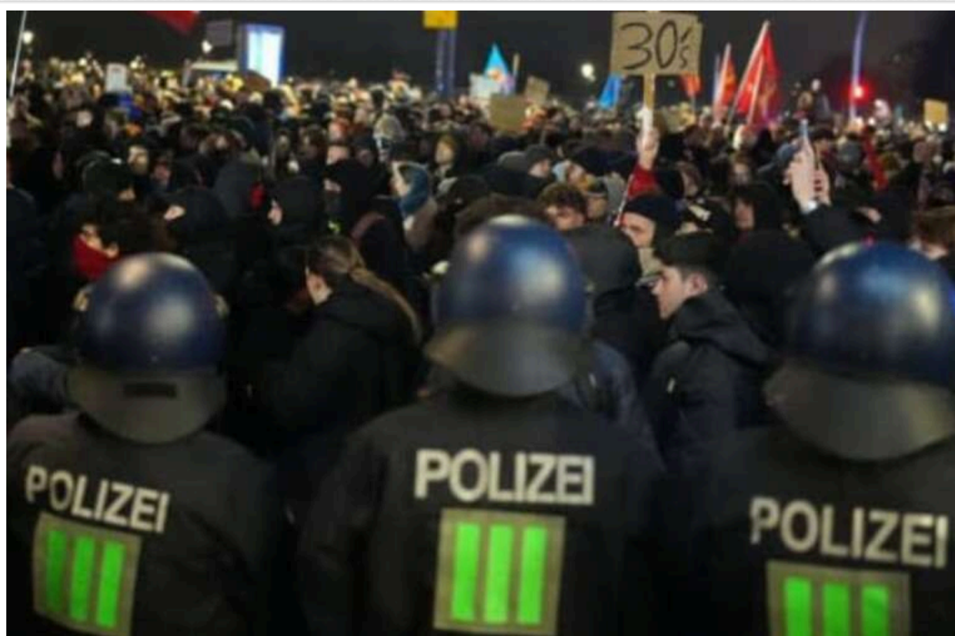
У Гамбурзі тисячі людей вийшли на протест проти візиту лідерки ультраправих з Німеччини

Близько 16 тисяч людей зустріли протестами лідерку партії "Альтернатива для Німеччини" Алісу Вайдель у Гамбурзі, куди вона прибула на партійний захід у будівлі мерії.