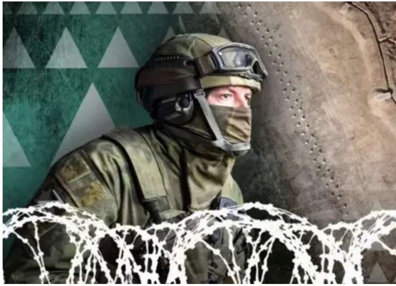
Україна не в змозі зупинити фланговий удар Росії під Покровськом, - Рьопке

Про це повідомляє військовий оглядач газети Bild Юліан Рьопке.