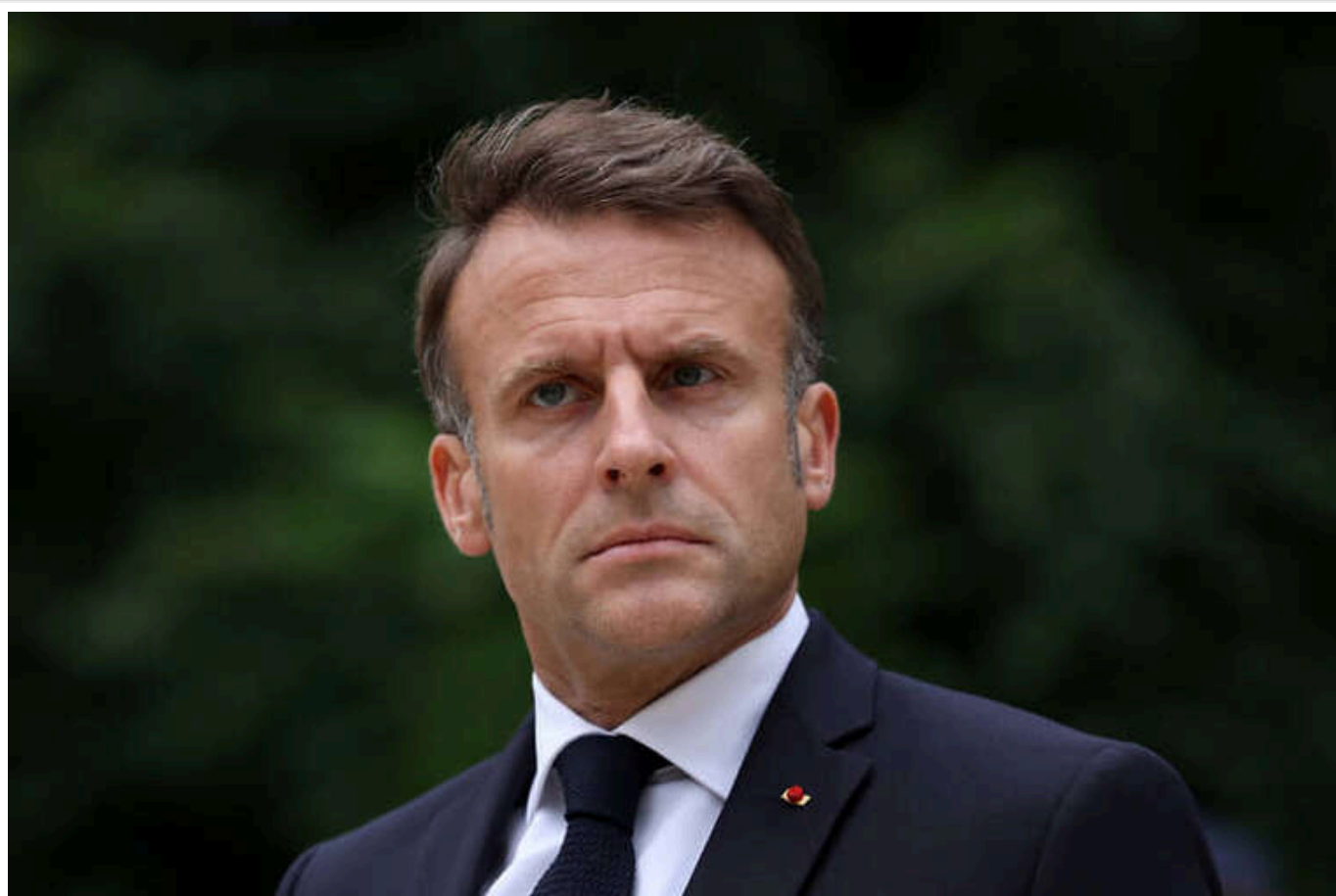
Макрон вирушив до Лівану, щоб допомогти в створенні уряду

Президент Франції Еммануель Макрон вперше з 2020 року відвідає Ліван. У цій країні він спрятиме прискоренню формування уряду, що може розпочати низку реформ.