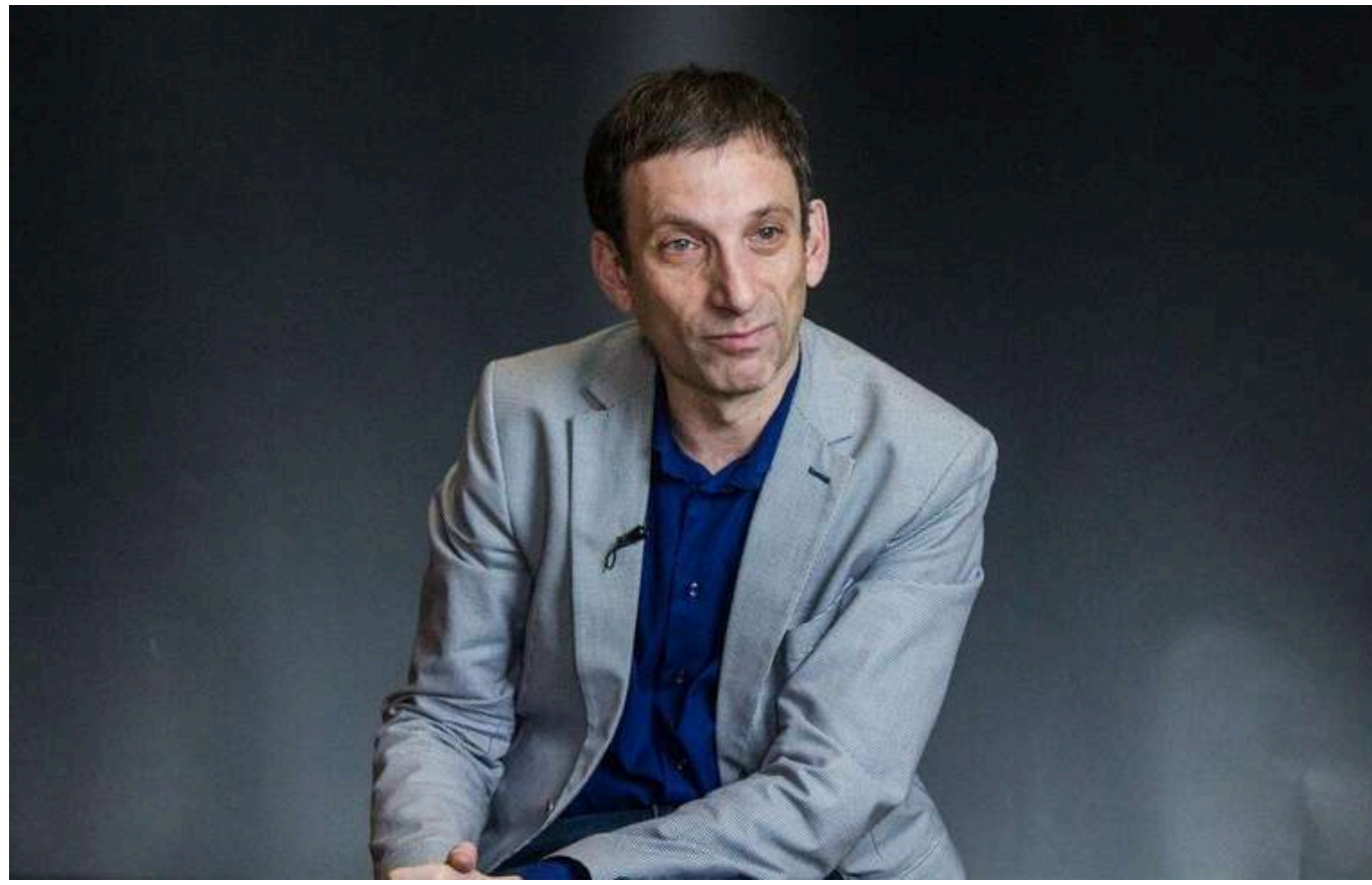
Телеведучий Портников після появи скандального відео заявив, що його хочуть вбити

На відео, яке нещодавно поширилося в соцмережах, Портников стверджує, що воювати повинні не представники еліти, а звичайні українці, оскільки «ми живемо в демократичній державі».