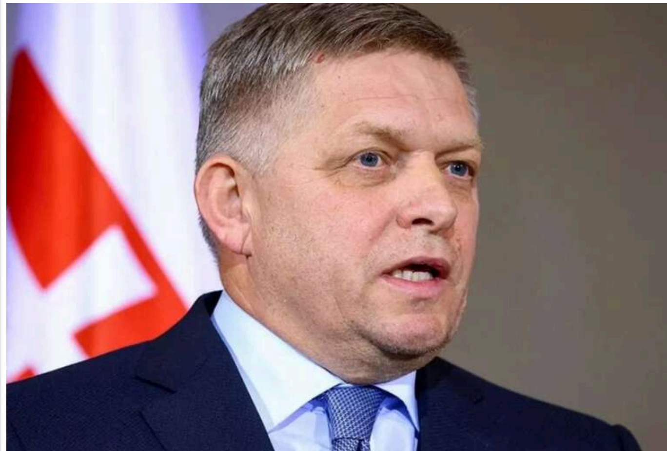
Фіцо може провести зустріч із Зеленським у найближчі дні, - ЗМІ

Прем'єр-міністр Словаччини Роберт Фіцо оголосив про зустріч з президентом України Володимиром Зеленським. Вона може відбутися найближчими днями.