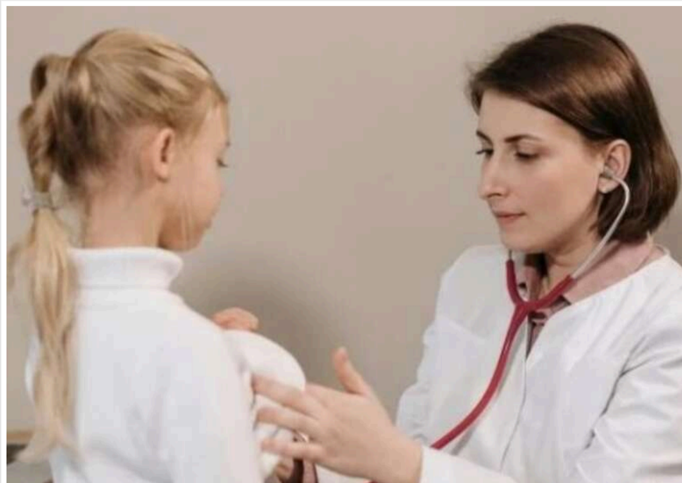
Міністерство охорони здоров'я затвердило оновлений порядок проведення медичних оглядів дітей в домашніх умовах та у лікарнях

Міністерство охорони здоров'я України затвердило оновлений порядок і періодичність проведення медичних оглядів дітей удома та в медичних закладах.