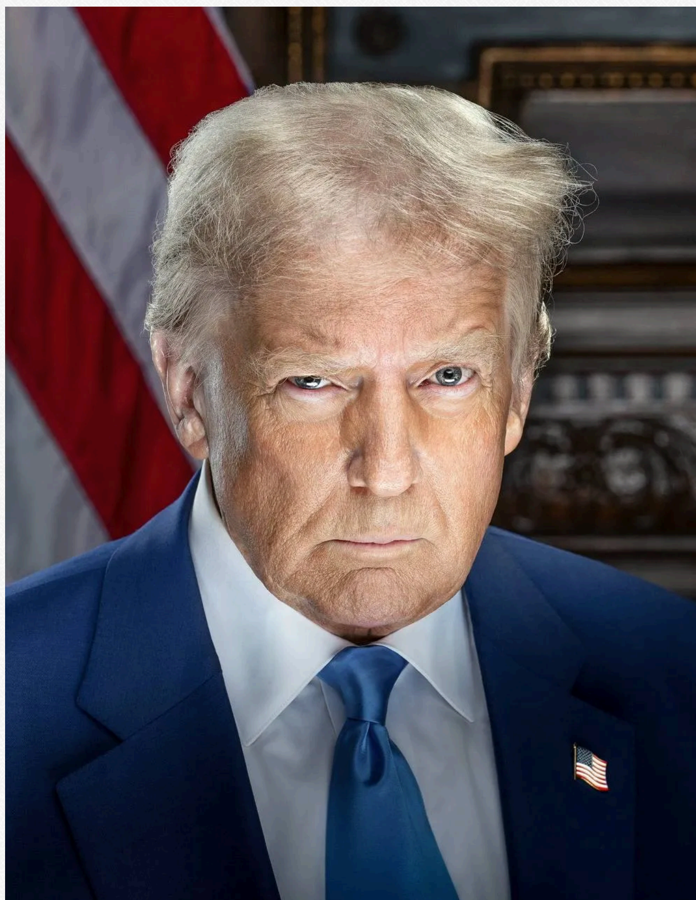
Інавгураційний портрет Трампа

Крім того, важко не помітити, наскільки відрізняються портрети Дональда Трампа за 2017 і 2025 рік. На першому він виглядає менш серйозно і посміхається. У той час як на актуальному портреті Трамп здається дуже зосередженим.