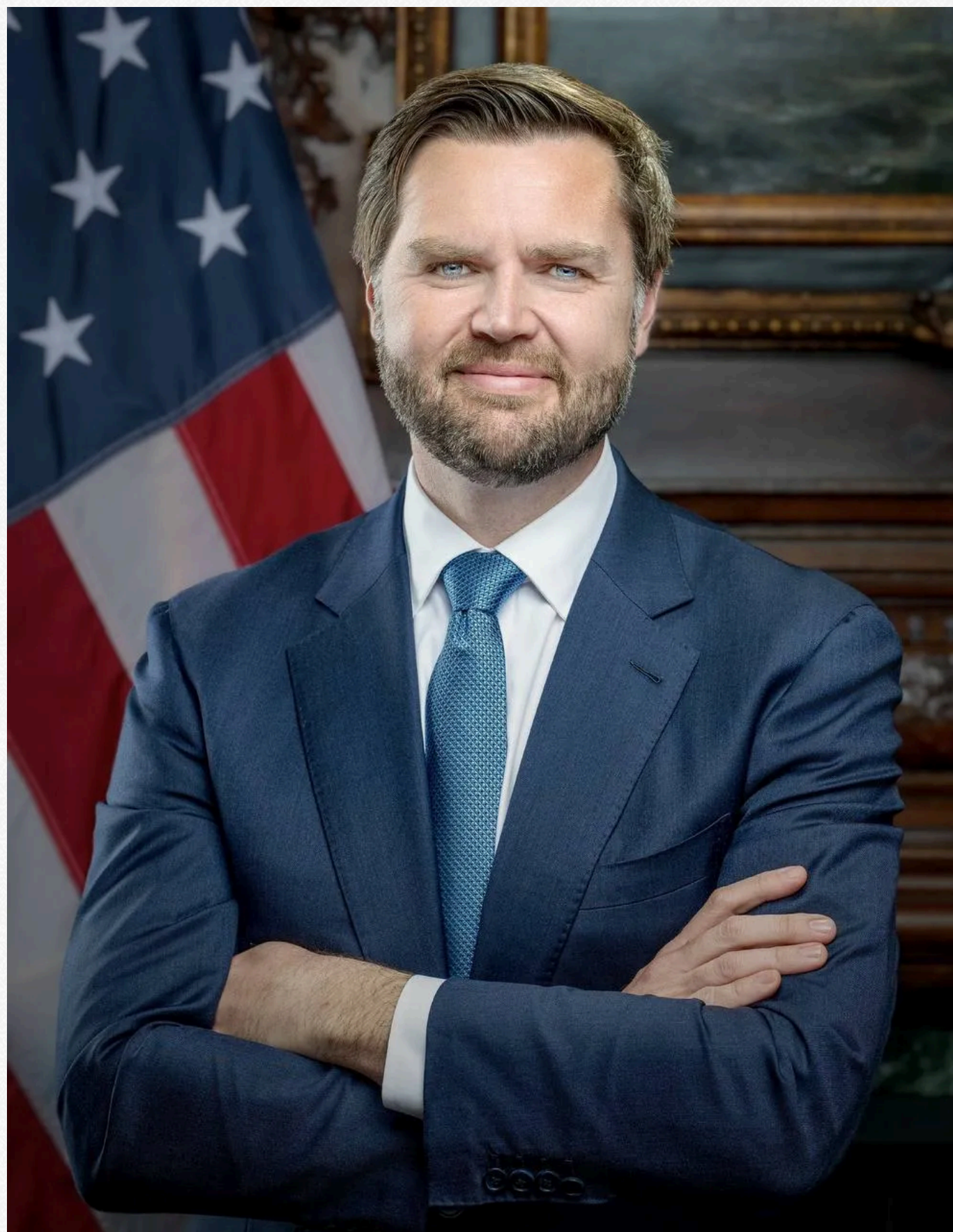
Інавгураційний портрет Венса

Портрет майбутнього віцепрезидента виглядає дуже офіційно і повністю відповідає його положенню. На портреті він зображений на фоні американського прапора.