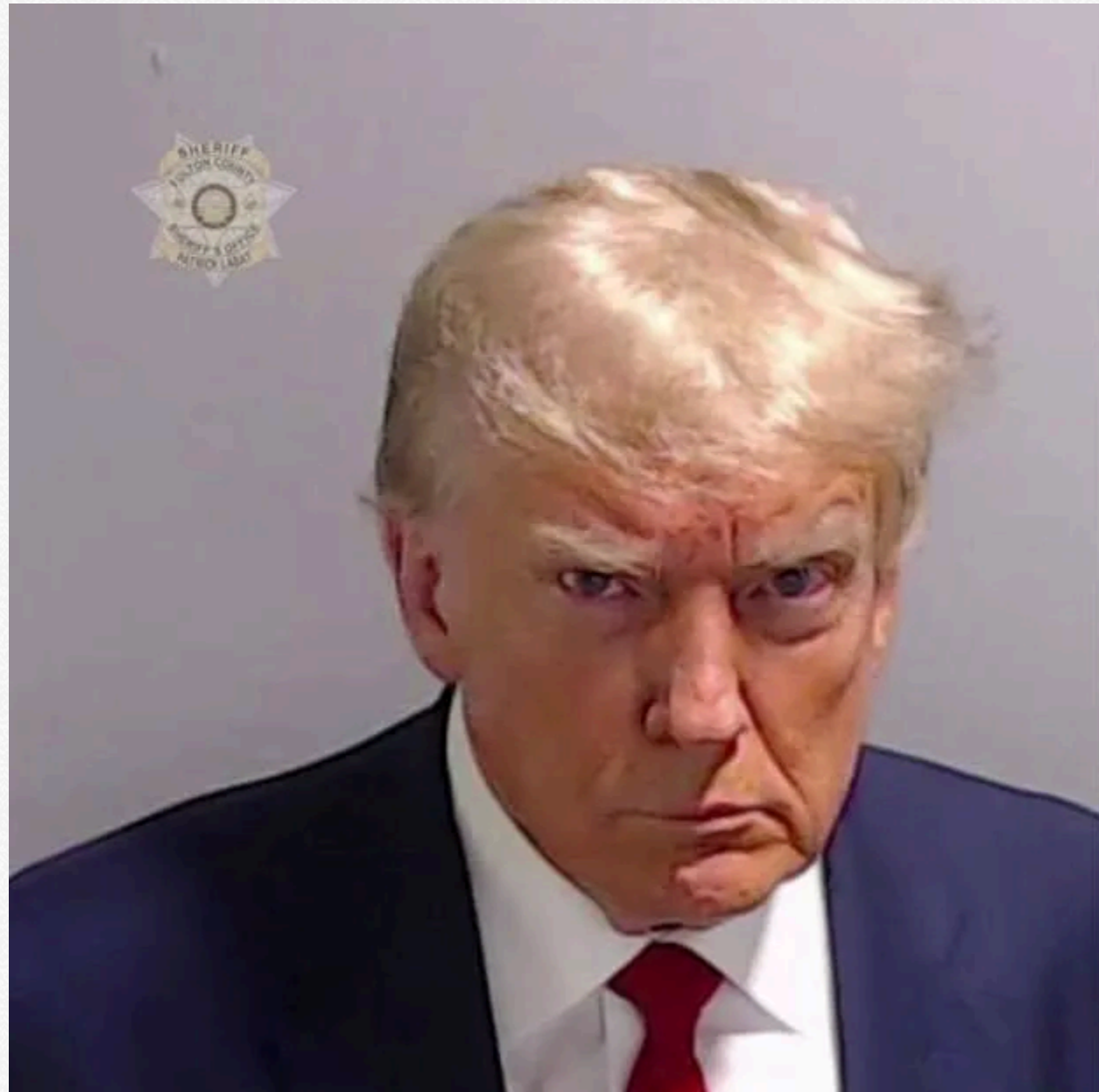
Фото Трампа з тюрми

Користувачі соціальних мереж виявили, що портрет новообраного президента схожий на його фотографію, зроблену в тюрмі округу Фултон у 2023 році. Цікаво, що цей знімок було зроблено в момент, коли Трамп пройшов формальну процедуру арешту за справою втручання у вибори.