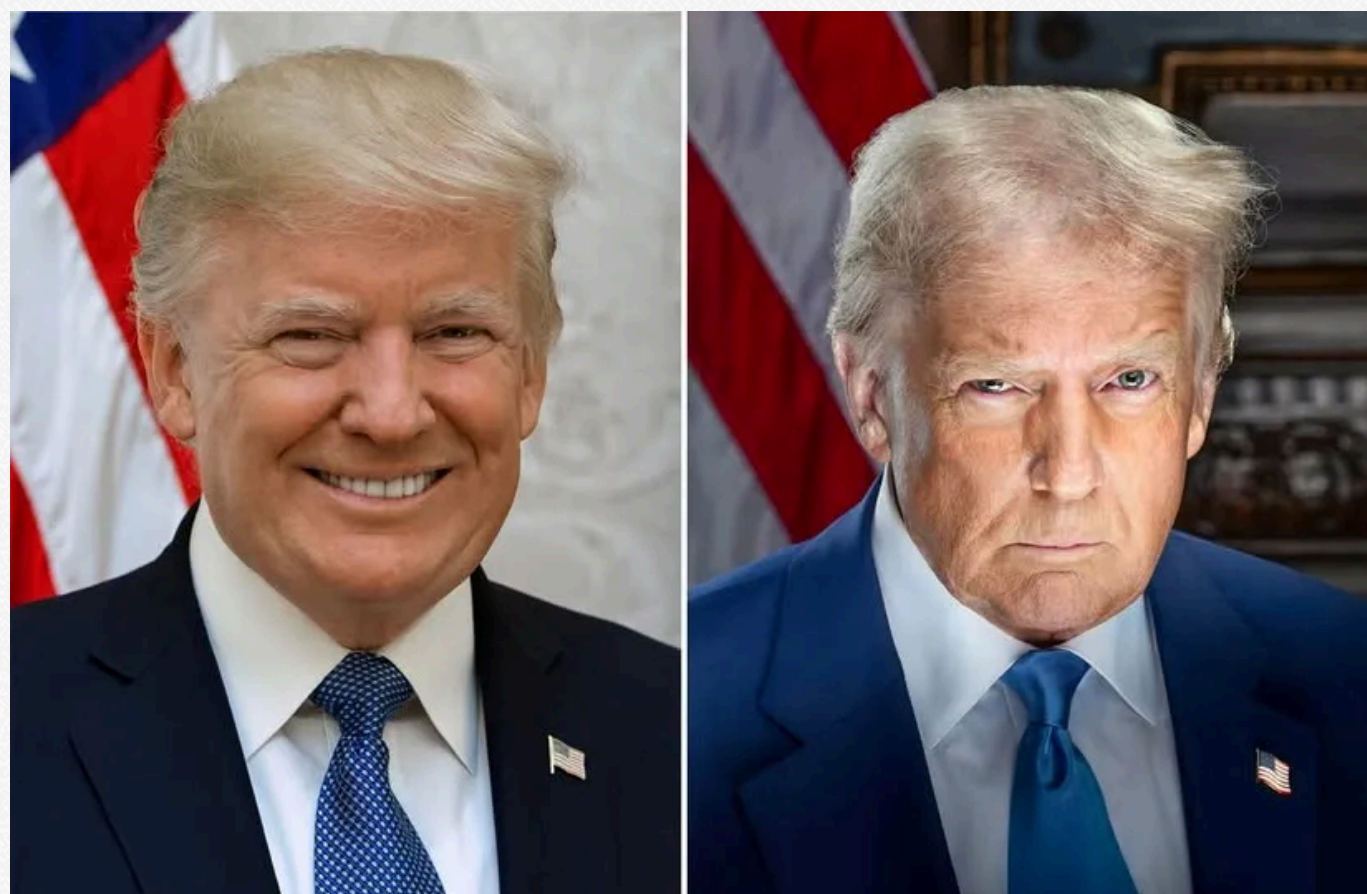
Порівняння інавгураційних портретів Трампа / Фото із соцмереж

Крім того, важко не помітити, наскільки відрізняються портрети Дональда Трампа за 2017 і 2025 рік. На першому він виглядає менш серйозно і посміхається. У той час як на актуальному портреті Трамп здається дуже зосередженим.