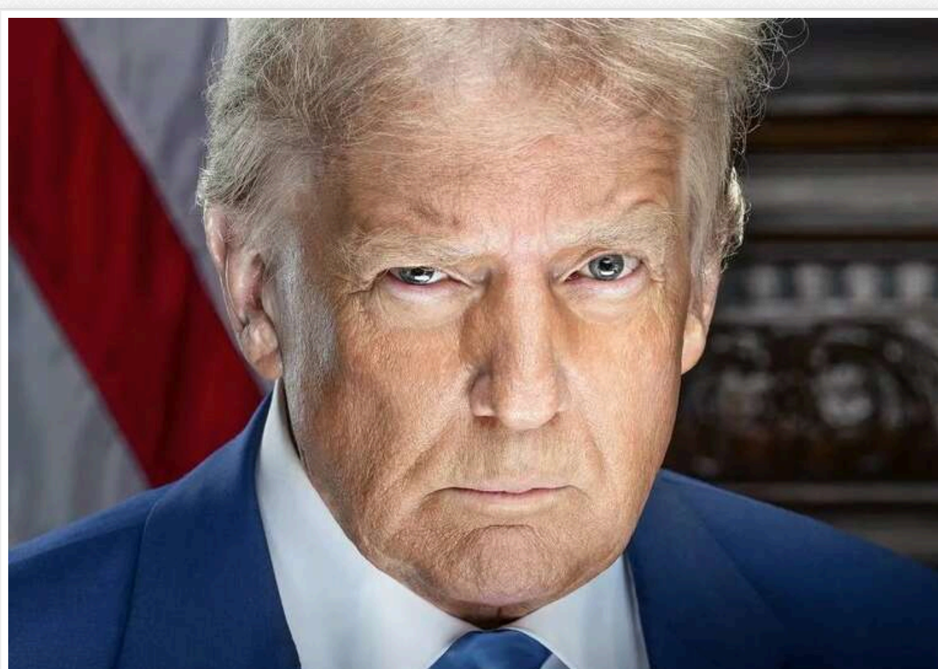
В США показали інавгураційні портрети Трампа і Венса: тепер серйозний, а не усміхнений

Скоро новообраний президент США Дональд Трамп знову повернеться до Білого дому. Віцепрезидентом стане Джей Ді Венс.