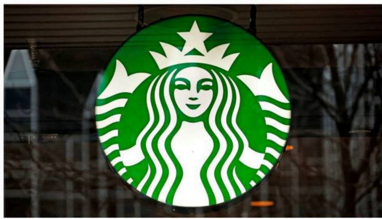
FILE – A Starbucks logo sign in the window of one of the chain's cafes in Pittsburgh, Jan. 12, 2017.

The company has issued a new code of conduct for customers, which includes a ban on vaping and panhandling.