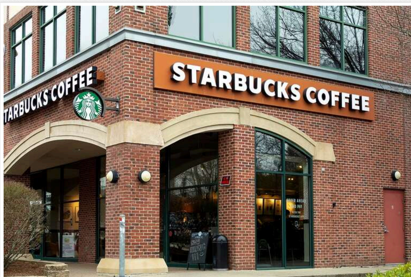
Starbucks заборонила користуватися туалетами всім охочим

Американська мережа кав'ярень Starbucks змінила свою політику, забороняючи відвідувачам, які нічого не придбали, перебувати в закладах і користуватися туалетами.