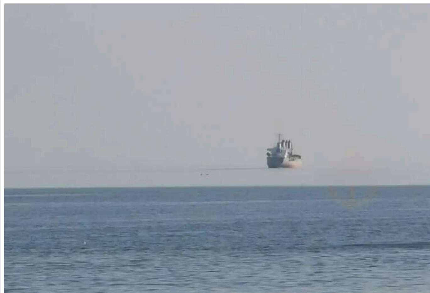
В Одесі помітили незвичайне явище: кораблі парять над морем

Морський міраж вдалося зафіксувати над Чорним морем: три кораблі наче левітували на лінії горизонту. Цю рідкісну природну оптичну ілюзію називають фата-моргана.