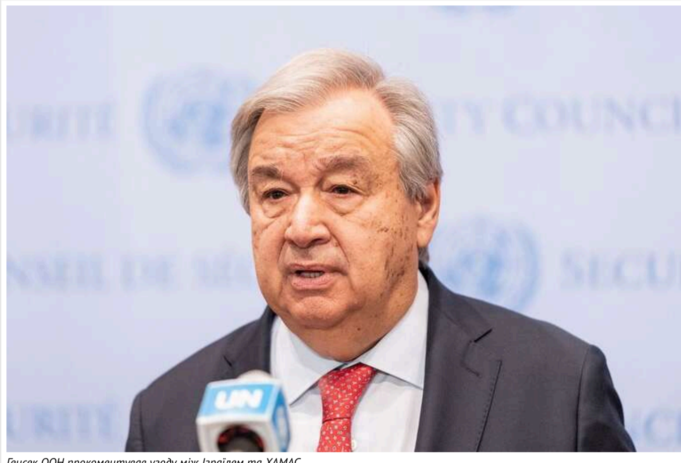
Генсек ООН прокоментував угоду між Ізраїлем та ХАМАС

Генеральний секретар Організації Об'єднаних Націй Антоніу Гутерреш привітає домовленість про припинення вогню в Секторі Гази та звільнення заручників. За його словами, ООН готова підтримати реалізацію цієї угоди.