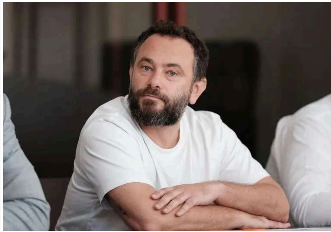
Дубінського внесли до реєстру корупціонерів - за матеріалами ДБР

Народного депутата України, якого Державне бюро розслідувань викрило на корупційному діянні, було внесено до Єдиного державного реєстру осіб, які вчинили корупційні або пов'язані з корупцією дії.