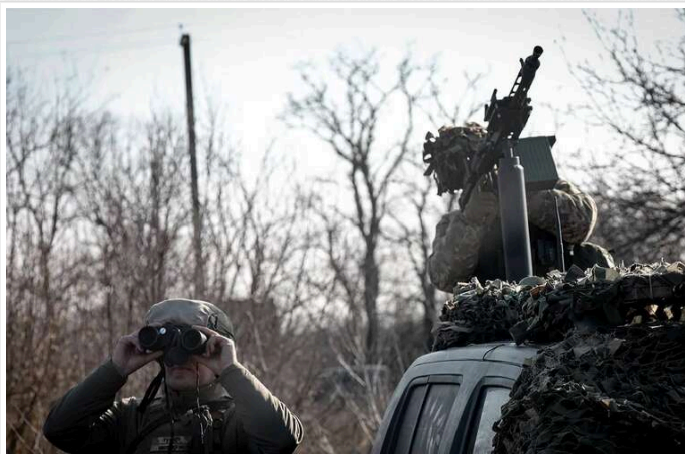
Росія вночі запустила 43 ракети та понад 70 дронів: Сили ППО знищили 77 повітряних цілей

У ніч на 15 січня Росія запустила проти України 117 повітряних цілей. Протягом операції з протиповітряної оборони (ППО) було знищено 77 з них.