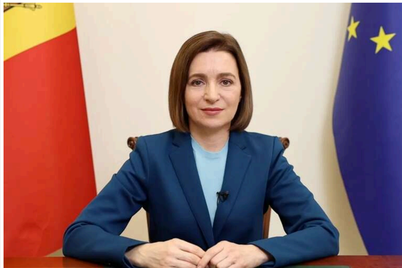
Санду звинуватила Росію в провокуванні енергетичної кризи в Придністров'ї

Енергетична криза в Придністров'ї спричинена не Молдовою, а Росією. На цей момент Кишинів не перешкоджає постачанню російського газу на "Лівий берег".